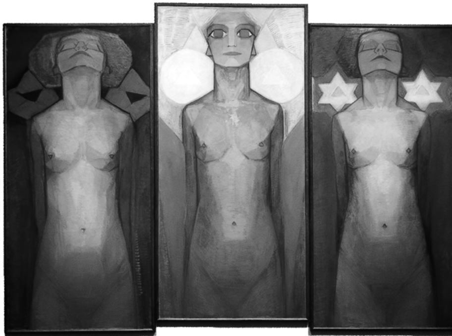
Piet Mondriaan (1872-1944); Evolutie , 1911